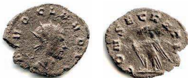
17- Antoniniano in lega di argento in memoria di Claudio II, divinizzato, successivo al 270, della zecca di Roma. Al Rovescio è l'aquila, attributo di Giove, che ha portato Claudio in cielo. N. Cat. 965