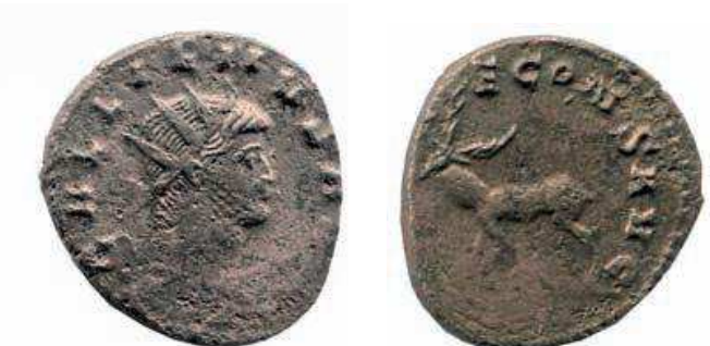
8- Antoniniano in lega di argento povero di Gallieno, del 259-268, della zecca di Roma. Al Rovescio è rappresentato un Cervo, animale sacro a Diana cacciatrice, della quale si chiede la protezione nella leggenda. N. Cat. 127