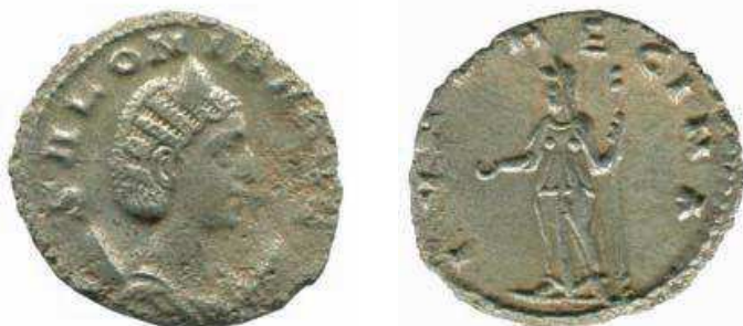
12- Antoniniano in lega di argento povero di Salonina, moglie di Gallieno, del 259-268, della zecca di Roma. Al Rovescio è rappresentata Iuno Regina , protettrice dell'imperatrice, con lo scettro e con la patera per le libazioni. N. Cat. 500