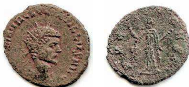
18- Antoniniano in lega di argento di Quintillo, fratello di Claudio II, imperatore per pochi mesi, del 270, della zecca di Roma. Al Rovescio è Pax, con lo scettro e il ramo d'olivo. N. Cat. 984