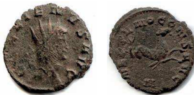
9- Antoniniano in lega di argento povero di Gallieno, del 259-268, della zecca di Roma. Al Rovescio è rappresentato un Ippocampo, del corteggio di Nettuno, del quale si invoca la protezione sul mare. N. Cat. 295