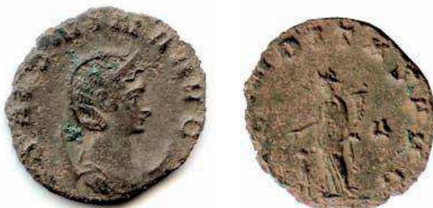
11- Antoniniano in lega di argento povero di Salonina, moglie di Gallieno, del 259-268, della zecca di Roma. Al Rovescio è rappresentata la personificazione della Fecunditas (la fertilità dell'imperatrice, che ha doto un erede all'imperatore, invito alla natalità della popolazione, che andava declinando) con la cornucopia e un bimbo. N. Cat. 478