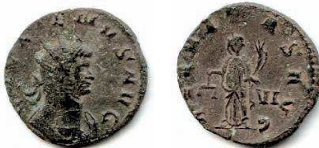
5- Antoniniano in lega di argento povero di Gallieno, del 259-268, della zecca di Roma. Al Rovescio è rappresentata la personificazione della Aequitas (la giustizia fiscale che genera ricchezza) che stringe la cornucopia. N. Cat. 63