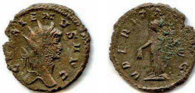
10- Antoniniano in lega di argento povero di Gallieno, del 259-268, della zecca di Roma. Al Rovescio è rappresentata la personificazione dell' Uberitas (la fecondità della terra), con la cornucopia e un grappolo d'uva. N. Cat. 386