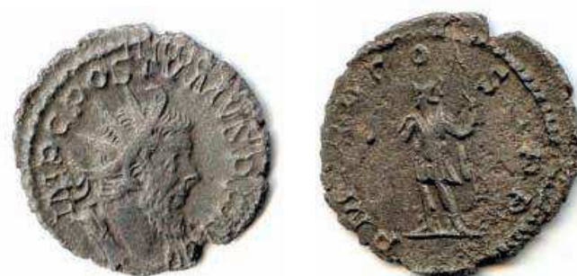
20- Antoniniano in lega di argento di Postumo, imperatore della Gallia (l'attuale Francia) , che si è resa indipendente, del 260, della zecca di Lugdunum (Lione). Al Rovescio è Mars, con lo scettro e il globo, simbolo del potere imperiale. N. Cat. 999