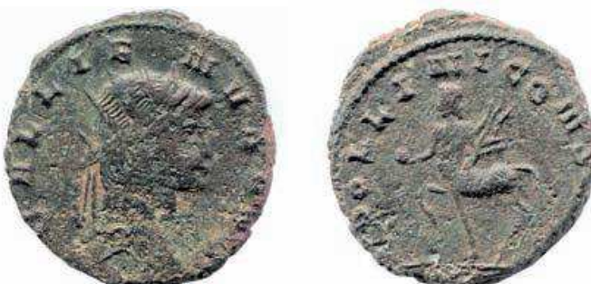
7- Antoniniano in lega di argento povero di Gallieno, del 259-268, della zecca di Roma. Al Rovescio è rappresentato un Centauro (stemma sulle insegne di una legione romana) con il globo e un trofeo militare. N. Cat. 106