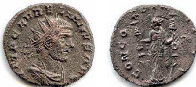
19- Antoniniano in lega di argento di Aureliano, del 270-275, della zecca di Siscia. Al Rovescio è la personificazione della Concordia, con due insegne militari nelle mani, simbolica della pacificazione dell'Impero. N. Cat. 993