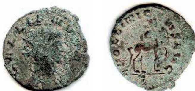
6- Antoniniano in lega di argento povero di Gallieno, del 259-268, della zecca di Roma. Al Rovescio è rappresentato il segno zodiacale di Gallieno, il Sagittario, sotto forma di Centauro, che tende l'arco. N. Cat. 89